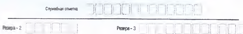
Рис. 5 Поля для служебного использования

Поля для служебного использования «Служебная отметка», «Резерв-2» и «Резерв-3» не заполняются.