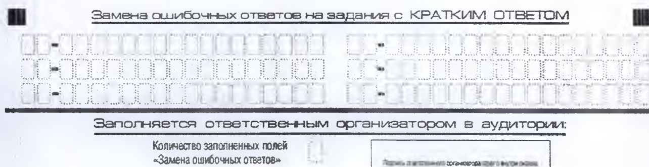
Рис. 9. Область замены ошибочных ответов на задания с кратким ответом

Запрещается записывать ответ в виде математического выражения или формулы. В ответе не указываются названия единиц измерения (градусы, проценты, метры, тонны и т.д.) – так как они не будут учитываться при оценивании. Недопустимы заголовки или комментарии к ответу.